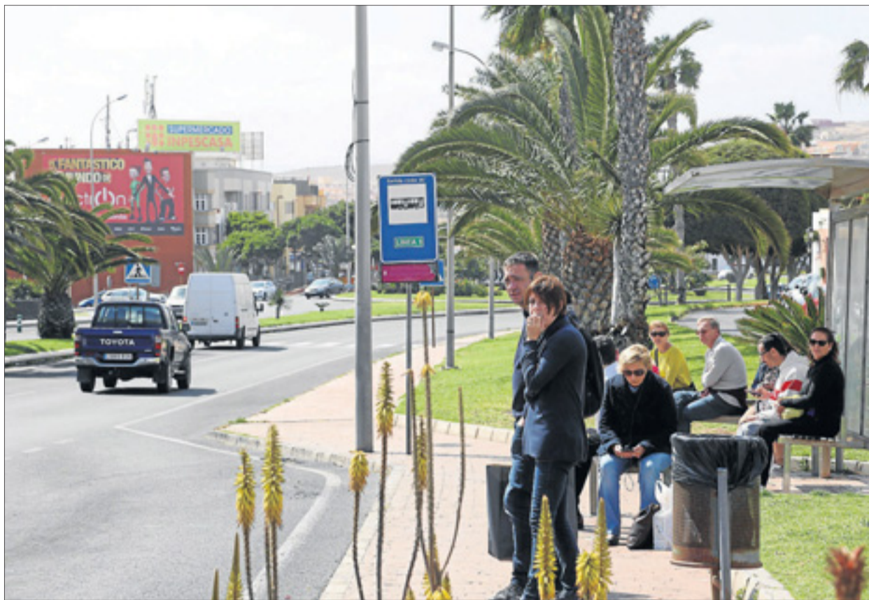
Desconcerto. Imagen de usuarios de guagua, ayer en la parada de Tamaragua, frente al centro comercial Las Rotondas.